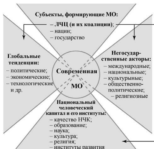
Рис. 2. 7 Структура МО

енной операций советско-российской армии, который показал как многие ее плюсы, так и минусы.